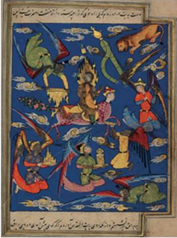
Resim 9: Hz. Muhammed'in Mi'râc yolculuğunda mühür taşımasıç ( Kısâs-ı Enbiyâ , BSB, 984, y. 226b)