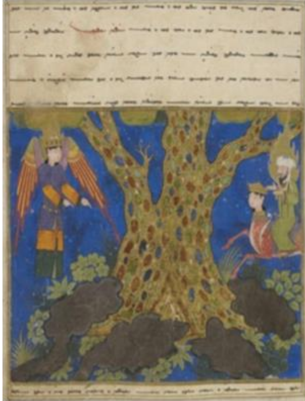
Resim 5: Hz. Muhammed'in Mi'râc'da Sidret'ül Muntehâ'ya yükselişi. ( Mi'râcnâme , PBN, Turc. 190, y. 34a)