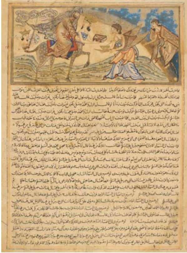
Resim 1: Hz. Muhammed Burak'a binerek iki meleğe doğru gidiyor. (Câmiü't-Tevârih, EUL, Or. Ms. 20, y. 55a)