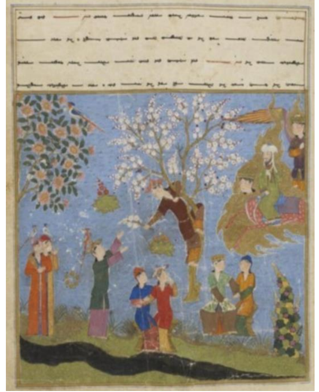
Resim 6: Hz. Muhammed'in Mi'râc'da cenneti ziyareti. ( Mi'râcnâme , PBN, Turc. 190, y. 49a)