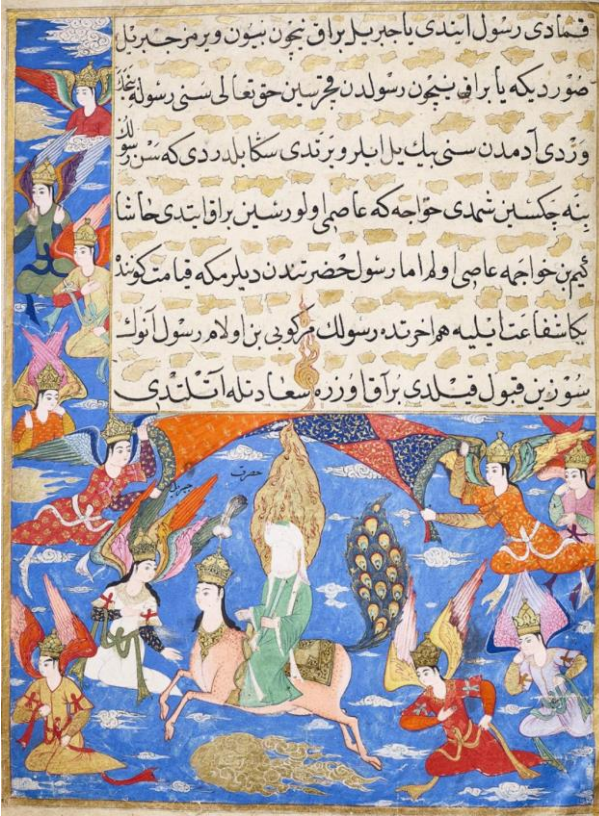
Resim 3: Hz. Muhammed Mi'râc yolculuğunda Mescid-i Aksâ'ya gidiyor. (Siyer-i Nebî, NYPL, Turk. ms. 3, y. 5a)