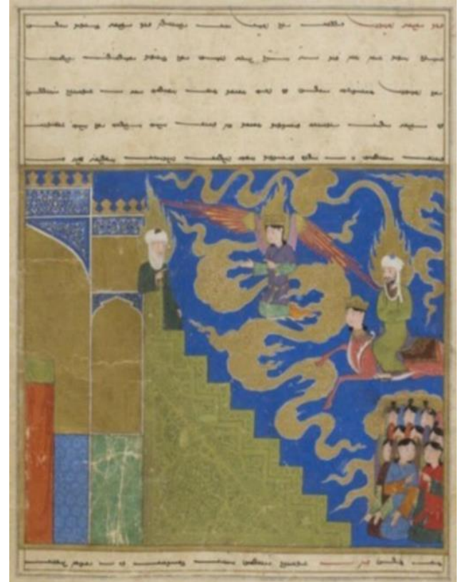
Resim 4: Hz. Muhammed'in Mi'râc'da Hz. İbrahim'le buluşması. (Mi'râcnâme, PBN, Turc. 190, y. 28b)