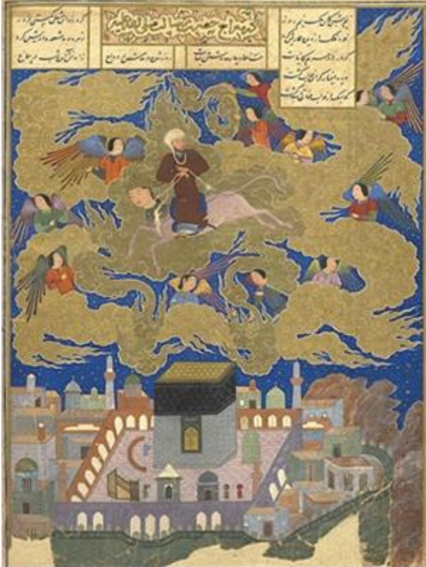
Resim 11: Hz. Muhammed Mi'râc'da Kâbe'nin üzerinden Mescid-i Aksâ'ya gidiyor. ( Hamse-i Nizâmî , BL, Or. 6810, y. 5b)