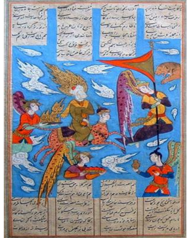
Resim 12: Hz. Muhammed'in Cebrâil Rehberliğinde Mi'râc Yolculuğu; ( Hamse-i Nizâmî , TSMK, R. 881, y. 48a)