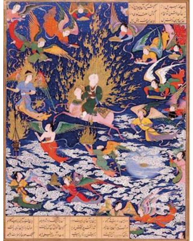
Resim 10: Hz. Muhammed Mi'râc'da göklerde ilerliyor. ( Hamse-i Nizâmî , BL, Or. 2265, y. 195a)