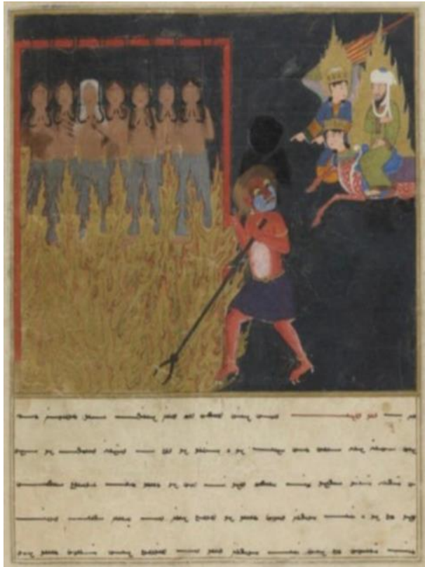
Resim 7: Hz. Muhammed'in Mi'râc'da cehennemi ziyareti. ( Mi'râcname , PBN, Turc. 190, y. 61b)