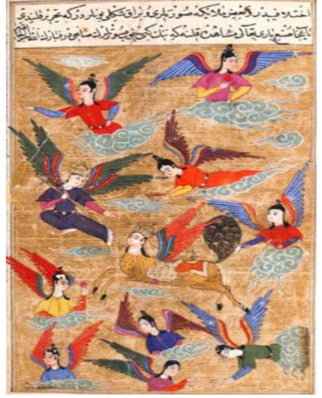
Resim 14: Gökte melekler arasında binicisiz Burak. ( Acâ'ibül Mahlûkât ve Garâ'ibü'l Mevcûdât , BM, Add. 7894, y. 61a)