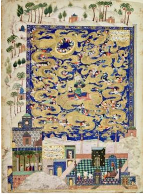
Resim 13: Hz. Muhammed'in bulutların içinde ve ötesinde göğe yükselişi; ( Hamse-i Nizâmî , Dallas, Keir Koleksiyonu)