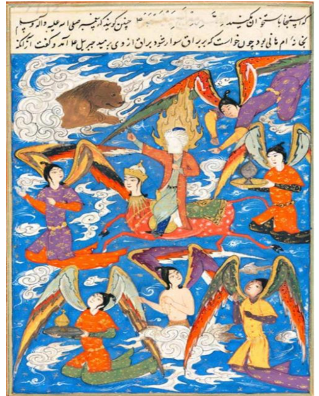
Resim 8: Hz. Muhammed'in mühürü aslana uzatması. ( Kisâs-ı Enbiyâ , TSMK, H.1228, y.152b)